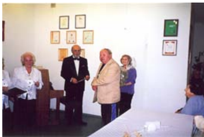
Dzień Pracownika Socjalnego